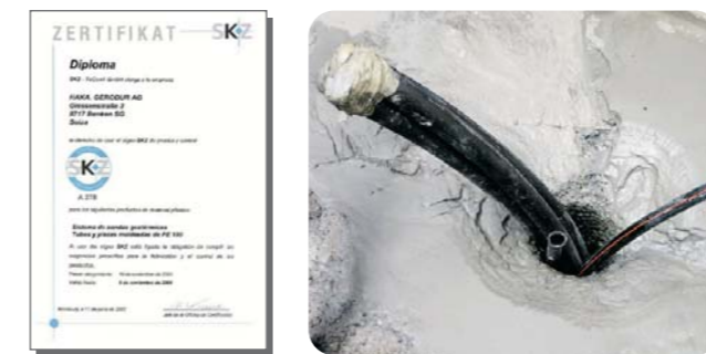
Sonda horizontal ALB PE 100 HD