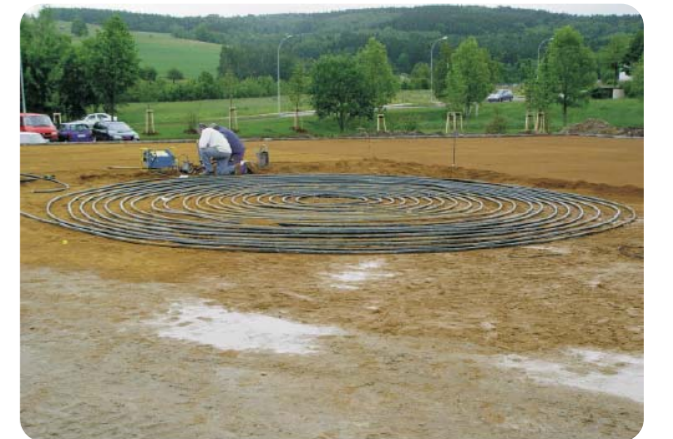
Colocación de una sonda horizontal.

Es importante tener en cuenta que este tipo de instalación puede provocar efectos secundarios positivos, como por ejemplo calefaccionado de superficies exteriores. Es también importante tener en cuenta la climatología local a la hora de decidir a qué profundidad colocar el tendido de tubería, pues el rendimiento estacional a lo largo del año es variable.