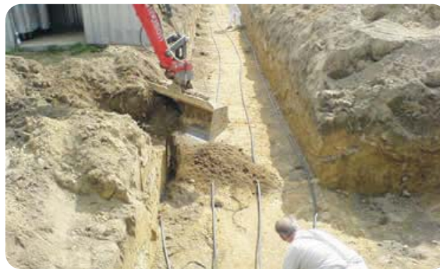
Instalación de una sonda horizontal. No se precisa perforación sino una excavación o movimiento de terreno para empotrar la tubería en el subsuelo a poca profundidad.