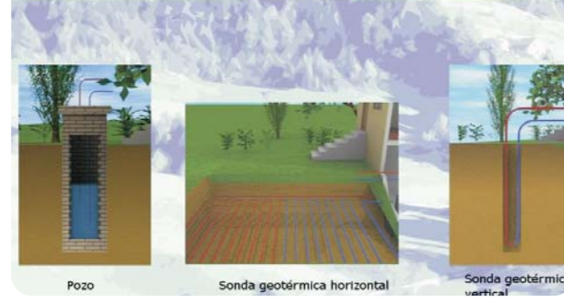
Fuente de energía renovable, estable, de bajo mantenimiento y compatible con otros sistemas de energía renovable. Apto para aplicaciones de climatización, agua caliente sanitaria y calefacción de piscinas entre otros.