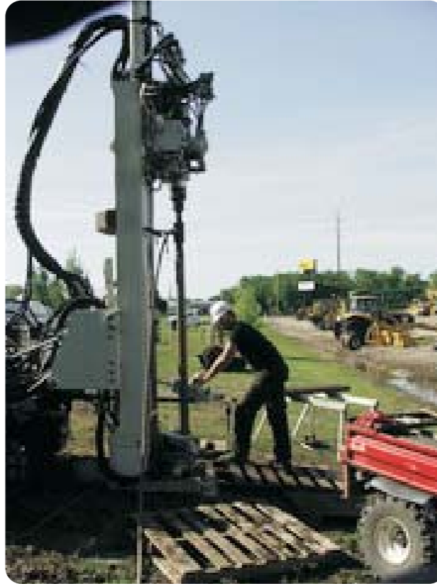
Perforación de una sonda vertical. La profundidad de la sonda es variable en función del rendimiento energético a conseguir y la calidad del terreno.

Ambas soluciones se complementan con un amplio programa de accesorios para satisfacer cualquier requisito de la instalación.